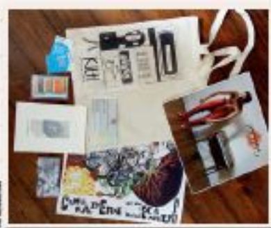
Voilà ce que contenait ce panier culturel "old school" : un film, des entrées pour un spectacle, un vinyl et une bière locale.