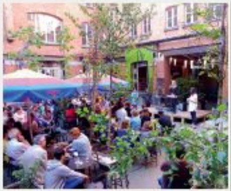
Le 6 juin dernier, le second panier culturel bruxellois était distribué au Bravo, dans le quartier Duwail.