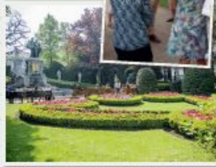
Pour l'ensemble culturel proposé, nous recommandons une visite guidée de jardin de Petit Sérénus et de parc d'Égypte.

> Arts &ia (visites guidées du patrimoine bruxellois). Programme et informations : 02 581 41 51 ou www.arts&ia.be .